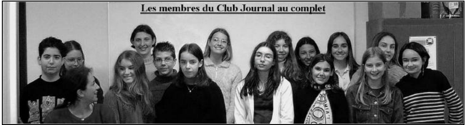
Les membres du Club Journal au complet