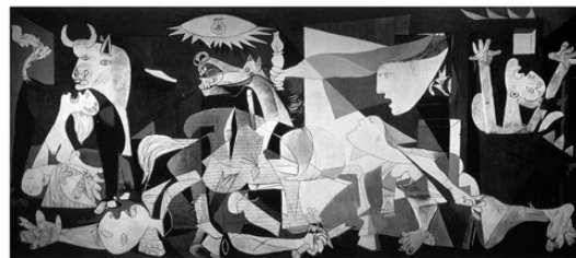
Pablo Picasso, Guernica, huile sur toile, 1937, 351 x 782 cm.

Les figures font face aux spectateurs comme une scène de théâtre, le cadrage horizontal accentue la proximité des personnages.